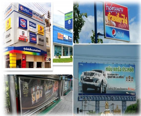
ป้ายที่ต้องเสียภาษี

๑. “ภาษีป้าย” คือ ภาษีที่เก็บจากการแสดงป้ายชื่อ ยี่ห้อ หรือโลโก้บนวัตถุใด ๆ ด้วยตัวอักษร ภาพ ไม่ว่าจะ เป็น บนป้ายทั่วไป ป้ายบิลบอร์ดตามตึกตามทางด่วน ป้ายผ้าใบ หรือป้ายไฟ ที่ใช้เพื่อหารายได้หรือการโฆษณา ซึ่งต้องเสีย ภาษีป้ายทั้งสิ้น ดังนั้น ถ้าเราเปิดร้านกาแฟที่ตึกแถวชื่อร้าน ว่า "Incquity Coffee" ที่มีป้ายร้านเป็นแผ่นไม้หน้าร้านหนึ่ง อัน และเป็นในรูปแบบผ้าใบอันใหญ่อีกหนึ่งอันก็ต้องเสีย ภาษีทั้งหมด ๒ ป้าย ด้วยอัตราภาษีที่ขึ้นอยู่กับรูปแบบและ ขนาดที่กำหนด