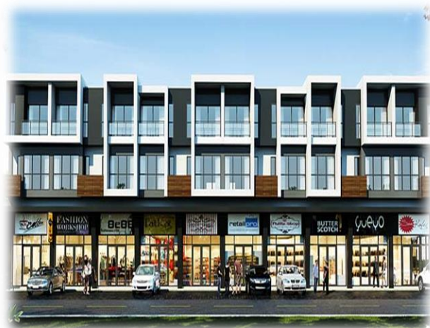
โรงเรือนและที่ดินที่ต้องเสียภาษี

๒. “ภาษีโรงเรือนและที่ดิน” คือภาษีที่เรียกเก็บ จากโรงเรือนหรือสิ่งปลูกสร้างอื่น ๆ กับที่ดินที่ใช้ ประโยชน์อย่างต่อเนื่องไปกับโรงเรือนและสิ่งปลูกสร้าง นั้น ถ้ากล่าวถึงโรงเรือนอาจยากที่จะเข้าใจความหมายว่า คืออะไร ซึ่งโรงเรือนในที่นี้หมายถึง อาคาร ตึกแถว บ้าน ร้านค้า สำนักงาน โรงแรม โรงภาพยนตร์ โรงพยาบาล ธนาคารโรงเรียน อาคารชุด หอพัก คลังสินค้า เป็นต้น ส่วนสิ่งปลูกสร้างอื่น ๆ นั้นหมายถึง สิ่งปลูกสร้างที่ก่อสร้าง บนที่ดินอย่างถาวร เช่น สะพาน ท่าเรือ ถังเก็บน้ำมัน อ่างเก็บน้ำ เป็นต้น ซึ่งสามารถสร้างรายได้ให้กับเจ้าของ กรรมสิทธิ์ได้ รวมไปถึงที่ดินซึ่งใช้ต่อเนื่องกับโรงเรือนและ สิ่งปลูกสร้างต่าง ๆ เป็นการใช้ประโยชน์ไปด้วยกัน บน ที่ดินที่ต่อเนื่องกัน